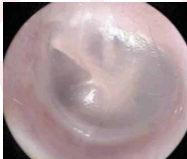
Slika 1. Endoskopski izgled normalne bubne opne

Akutna upala srednjeg uva (AOM) je učestala bolest u ranom detinjstvu (sa vrhom incidence između šest meseci i dve godine), ali takođe se javlja i kod starije dece i nešto ređe kod adolescenata i odraslih. U postavljanju dijagnoze treba znati da hiperemija, promenjen izgled bubne opne bez sekrecije iz uva ili izbočenja bubne opne nisu sigurni znaci akutne upale srednjeg uva (Slike 1 i 2). Izbočenost bubne opne je najznačajniji znak 6 . Po nekim autorima, pneumokok je češće povezan sa izmenjenom bubnom opnom (izbočenje), bolom u uvu i povišenom telesnom temperaturom, dok Hemofilus , pored otoloških simptoma, daje i okularnu simptomatologiju, najčešće u vidu konjuktivitisa 7 .