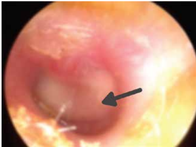
Slika 2. Endoskopski izgled bubne opne u AOM, strelica označava izbočeni deo

Propisivanje antibiotika u dečjem uzrastu je po nekim podacima iz Sjedinjenih Američkih Država najčešće u lečenju akutnog otitisa 10 . Po nekim procenama, čak i do 80% dece dobija antibiotik odmah, na prvom pregledu. Na svu sreću, najčešći pedijatrijski slučajevi AOM nisu teži oblik upale. Neka istraživanja pokazuju da od sedmoro dece samo jedno ima benefite od korišćenja antibiotika 11 . Postoje podaci koji govore da primena antibiotika ima efekte u smanjenju eksudata u šupljinama srednjeg uva čak i do 6 nedelja nakon primene, prevenirajući rani recidiv AOM i razvoj perforacije